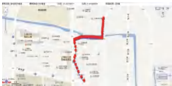
图6 标注后的管线图