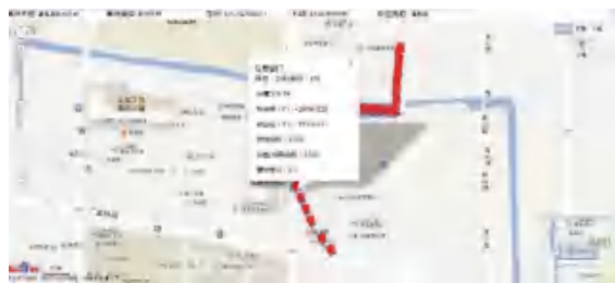
图7 信息窗口展示图

将所有转换后的井点坐标和数据信息依次引入,即可完成井点信息窗口的添加工作。打开的信息窗口如图7所示。