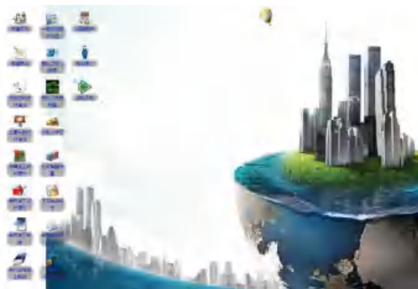
图 3 系统主界面

本文通过 HTML5+CSS3+JavaScript 对系统界面进行设计,包括登录界面、功能栏和地图窗口。功能界面包括新建项目、查看项目、属性编辑、查看二三维图、导出 WebGIS 等。地图窗口显示管网图、影像图、路况信息等基础数据。利用 HTML5 的 <head>、<body>、<div>、<title>、<span>、<u1> 等多功能插件,有效提高了软件开发效率。其中,<li>等标签来创建界面结构并丰富其内容,通过元素的样式、style 属性规定元素的行内样式并覆盖任何全局的样式设定。在标签内添加 onclick,规定当被定义的事件发生时执行的 JavaScript [4] 。系统登陆后主界面如图 3 所示。