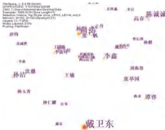
图 2 作者间的研究合作图谱

即发文数量超过四篇的均为核心作者,如戴卫东(22 篇),荆涛(13 篇),孙洁(7 篇),陈诚诚(7 篇),李鑫(7 篇),谭睿(5 篇)。