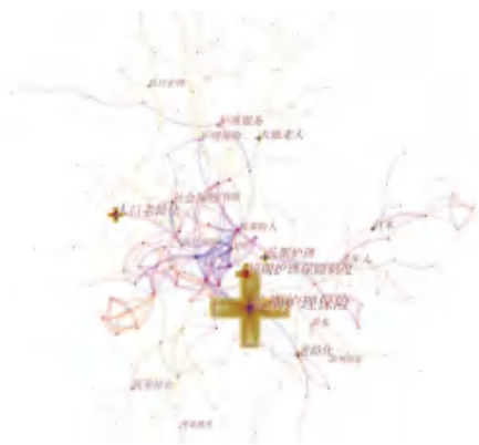
图3 关键词的知识图谱

该类问题,无法承担养老保障的主题责任,为此社会保险也成为该领域研究的热点高频词,面对该国情 [3] ,中国充分借鉴国外丰富经验,不断进行方法论创新,提出医养结合,医疗机构与养老服务提供方联手,保障长期护理服务的质量,2016年6月16号,国家卫计委与民政部联合下发《关于确定第一批国家级医养结合试点单位的通知》,但仍存在较多问题,如医疗、养老服务主体的积极性,管理问题及操作成本较高,因此,适合中国国情的长期护理保险制度仍在探索中。