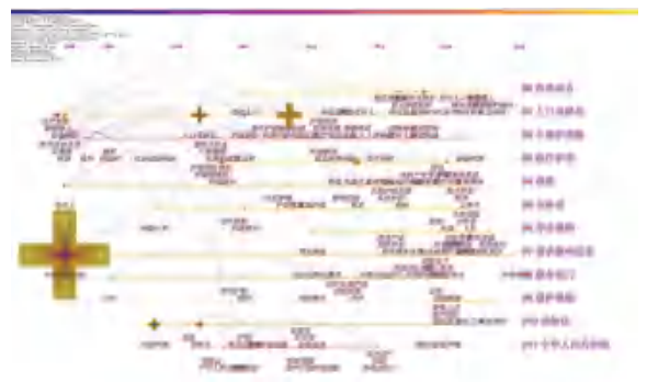
图5 对高频关键词的聚类解析结果

(11) 人口老龄化主要包括以下关键词: 人口老龄化、社会保险、护理保险、保险需求、保险责任、护理制度等。九个聚类中,有两个聚类与人口老龄化有关,可见建立长期护理保险制度的必要性。