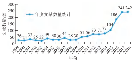
图 1 长期护理保险研究文献的历史分布

发文量的年度历史分布是反映某个研究领域现状及研究进展的重要指标,绘制相应的分布图,可以较为直观地了解该研究领域所处的发展程度及其阶段。对所检测到的文献进行初步梳理,得到长期护理保险研究文献的历史分布,如图 1 所示。观察图 1 中曲线的走向,不难发现,研究初期,由于理论基础较为缺乏,研究团队较为薄弱,学术基础不牢固,文献量较少。随着更多机构和学者的加入,长期护理保险研究便逐渐走向成熟,论文发文量呈现井喷式增长。